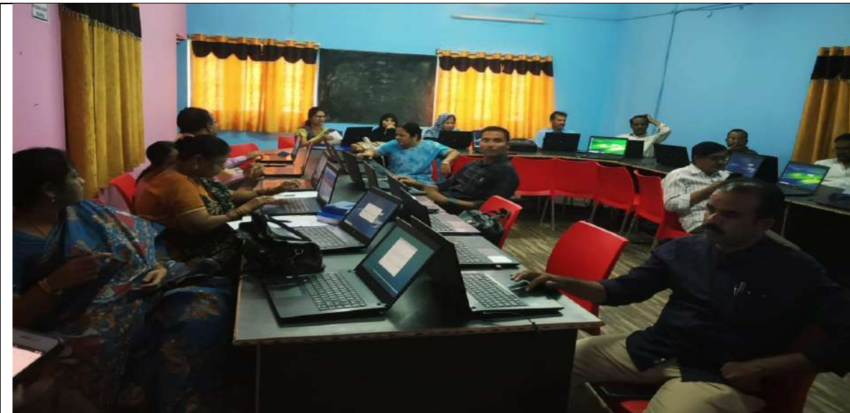
Hands on Training on ASSESSMENT AND EVALUATION THROUGH h5p