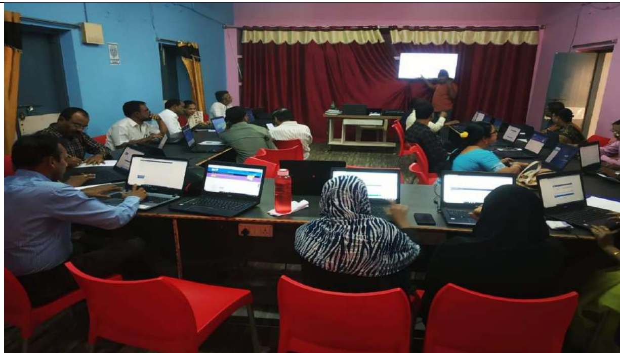
WORKSHOP ON USE OF ICT IN TEACHING AND LEARNING-17.6.2020.