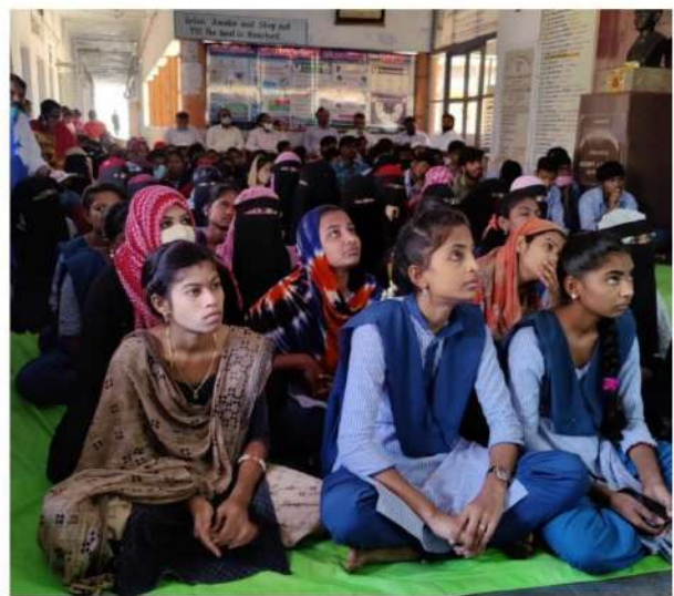
IPR (Intellectual property rights) Workshop conducted on 14.03.2022 in collaboration with IPR Awareness Mission, (NIPAM) Chennai Division.