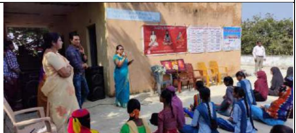
Sushumna Kriya Yoga held on 22.12.2021 – in collaboration with Sushumna Kriya Yoga, Kadiri divisional branch.