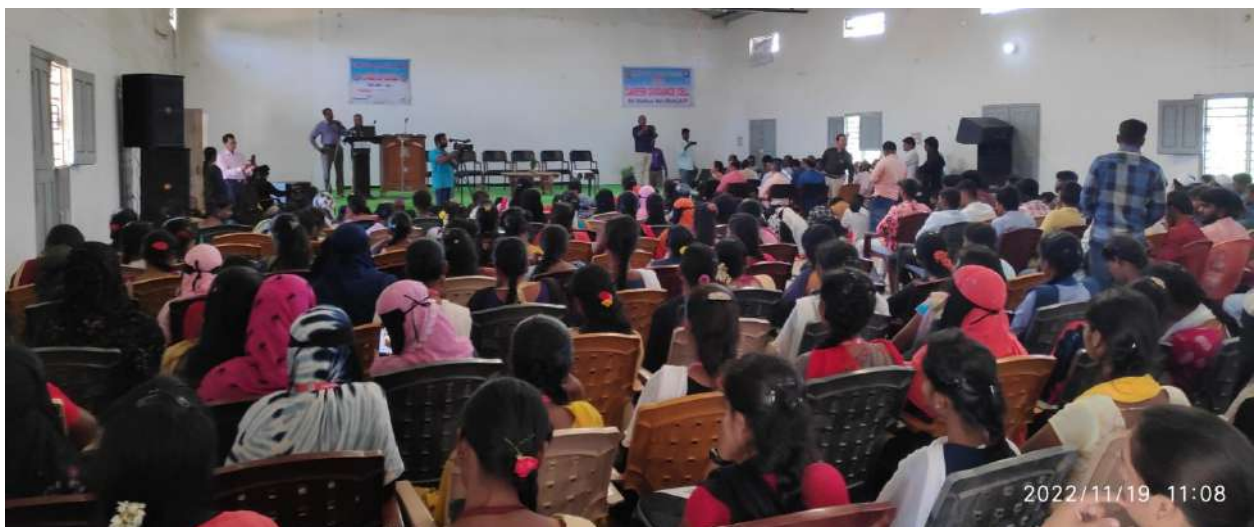
Career Guidance Programme conducted on 19.11.2022 to motivate students. The programme was conducted in collaboration with Kadiri Revenue and Police Departments.