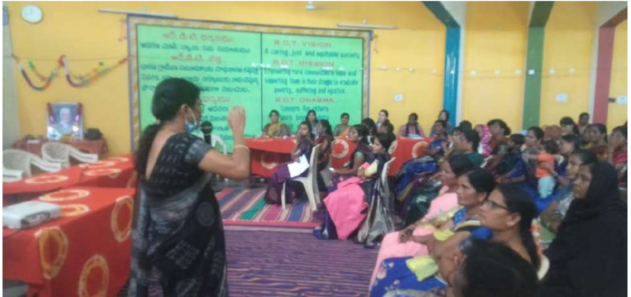
Participating in RDT women entrepreneurs summit on 19.08.2019

Conducted Interior Decoration Skill Development Programme in collaboration with Ranjan Plastic Makers from Anantapuramu on 02.07.2019