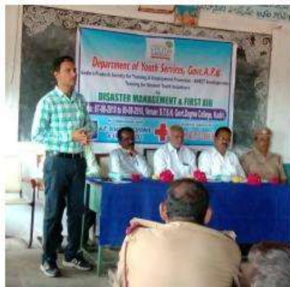
Workshop on Disaster Management