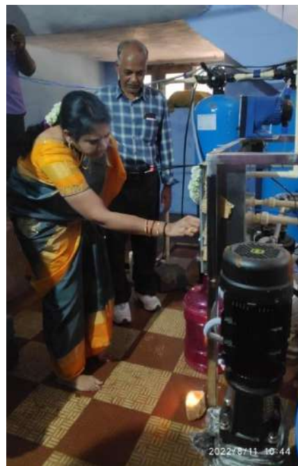
RO System for drinking water inaugural function held on 11.08.2022 in collaboration with Vajra Foundation as quality initiative.