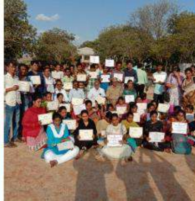
Participation of Camp