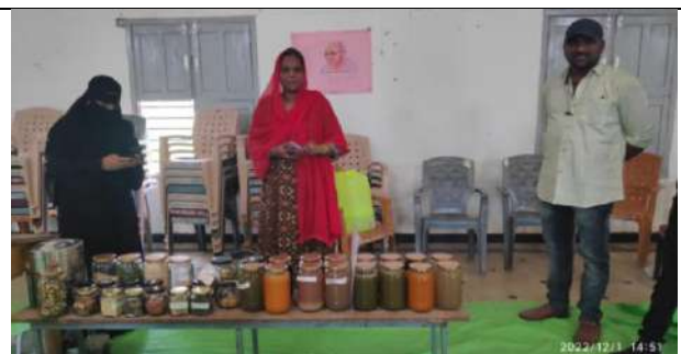
Conducted a workshop on Organic Food and Food Adulteration on 01.12.2022 in collaboration with an NGO, Kadiri.