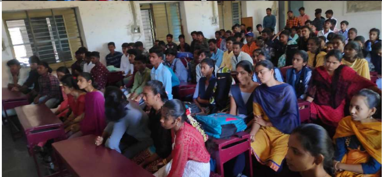
Student Induction and Inspiring Programme held on 17.11.2022 in collaboration with SBI, Kadiri Branch Officers to motivate students in choosing their career path