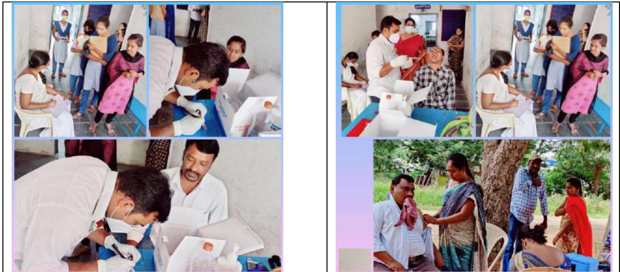
Conducted Corona Testing and Vaccination Programme in collaboration with Kadiri Area Hospital on 04.10.2021.