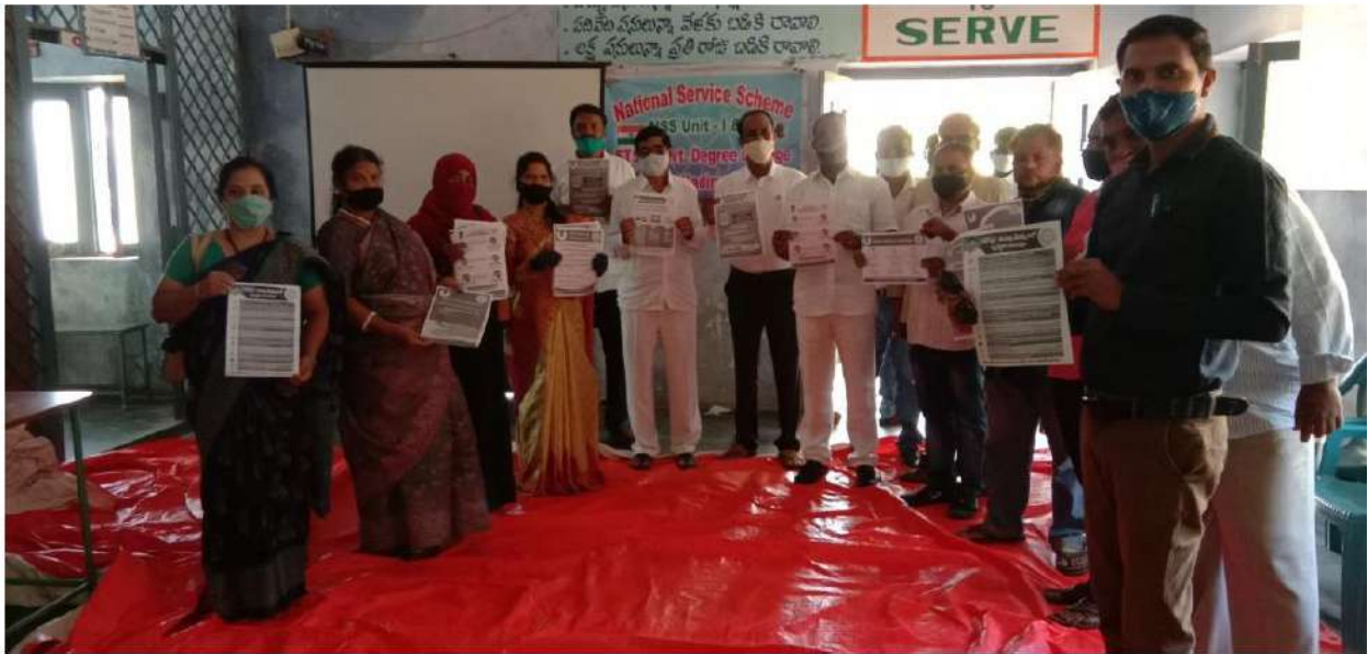
Conducted Corona (COVID-19) Awareness programme on 17-12-2020 in collaboration with COVID -19 Team