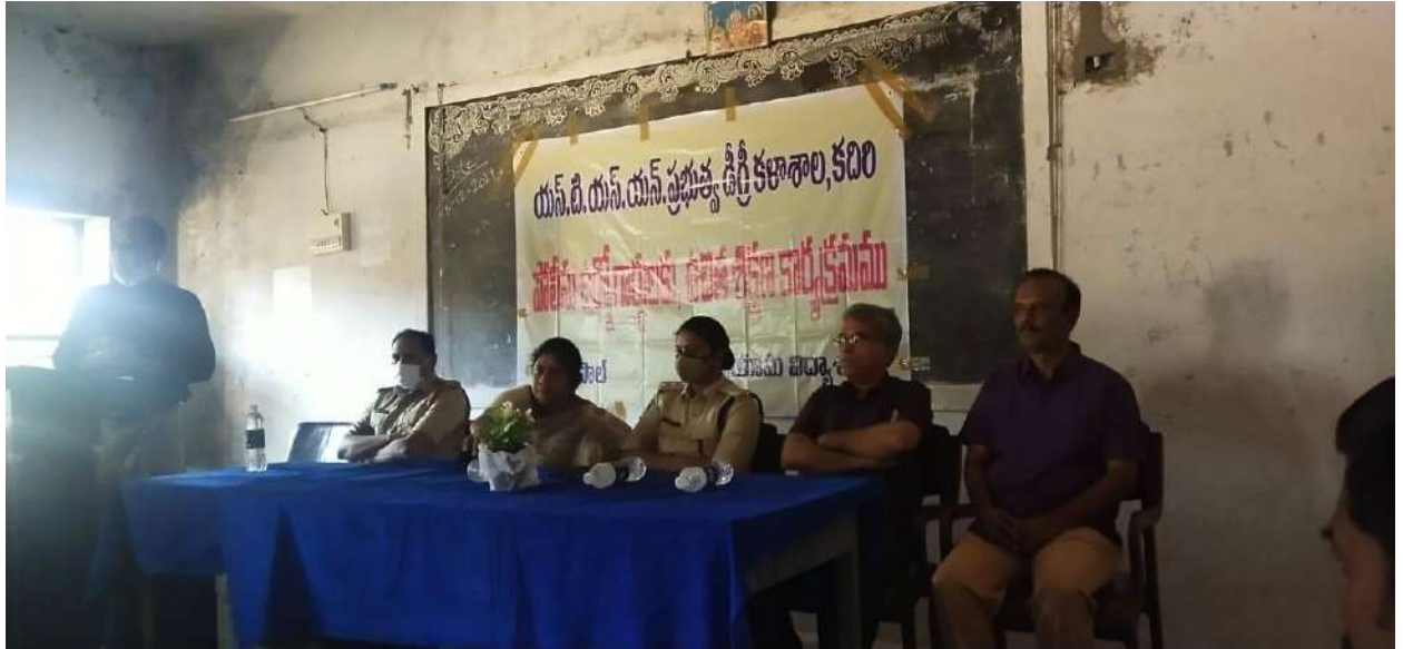
Awareness programme on preparation for competitive examinations held on 20.11.2021 in collaboration with Police Department.