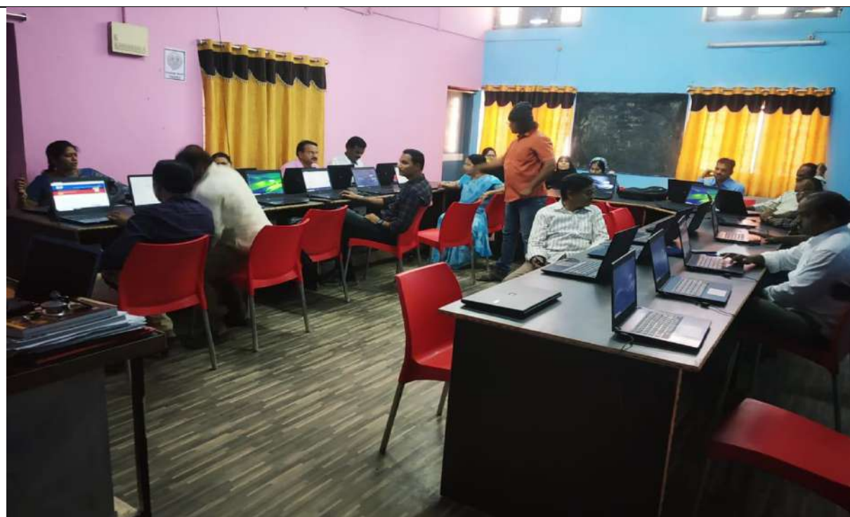
Introduction on MOODLE