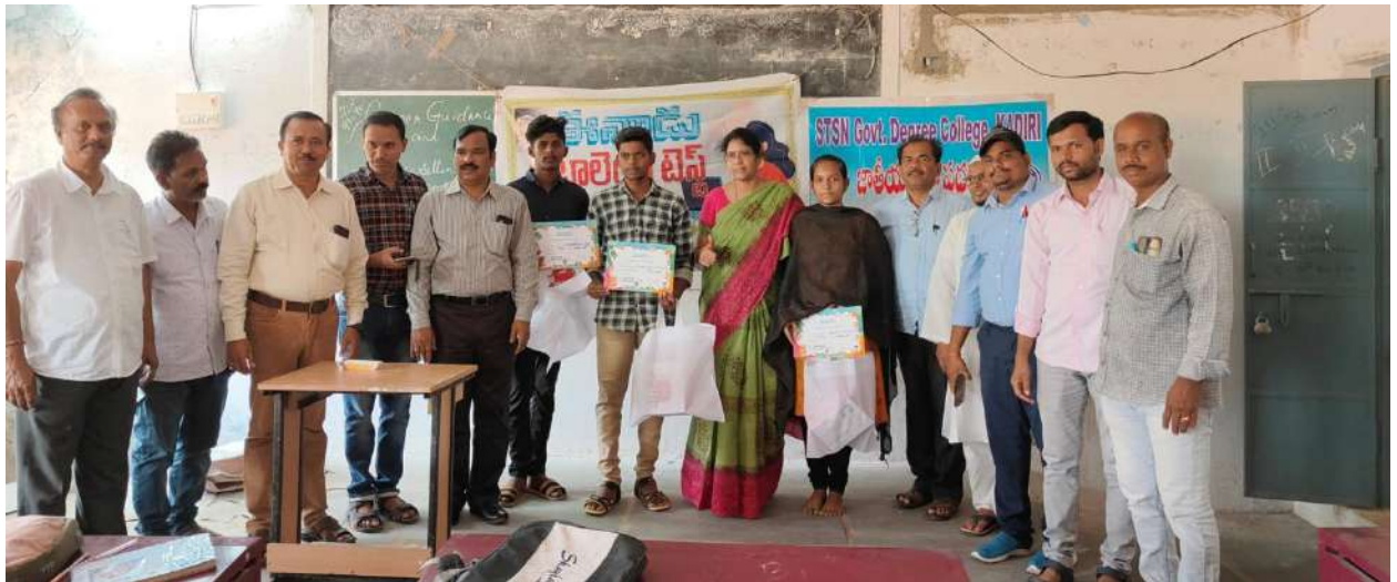
Eenadu Talent Test conducted on 29.03.2023 in collaboration with Eenadu daily news paper to identify the rural talented students