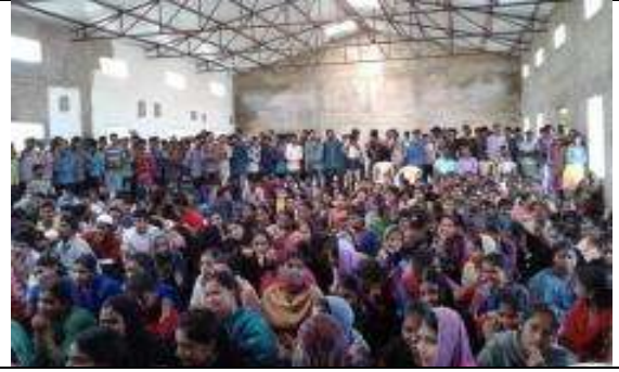
Awareness Programme on Police Job Recruitment conducted on 11.11.2018 in collaboration with divisional Police officers, Kadiri.