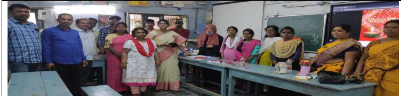
Food and Art Festival conducted on 21.10.2022 to bring out the entrepreneurial skills among the students.