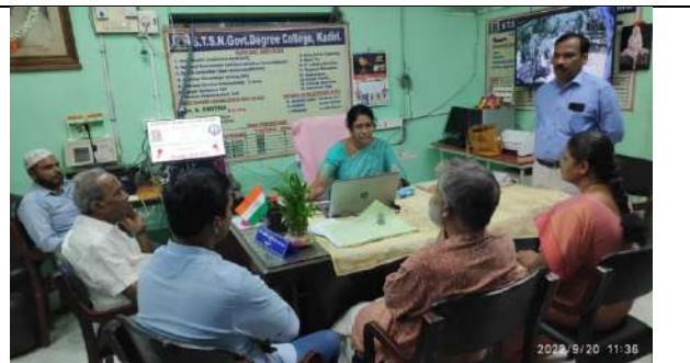
Conducted CPDC Meeting on 20.09.2022 to discuss the ways and means to develop the infra structure in the college.