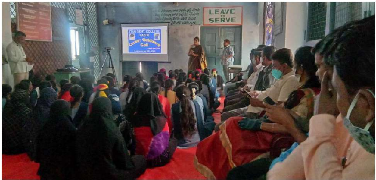
Career Guidance given to the students in collaboration with ID College on 15-12-2020