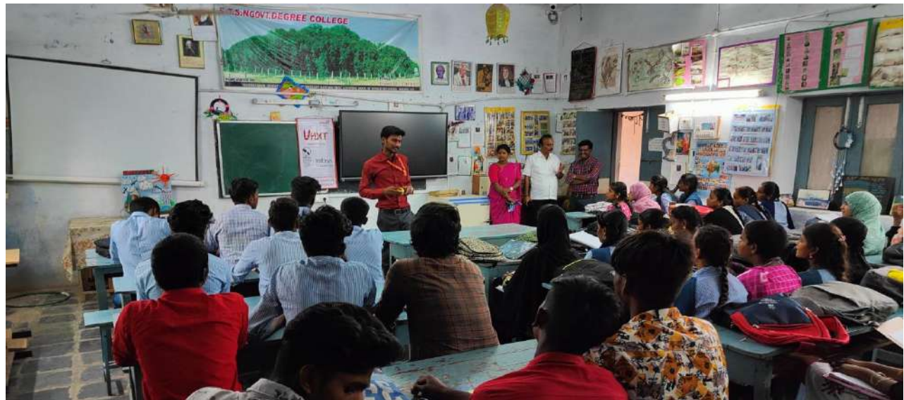
Life Skills and Spoken English Programme conducted in collaboration with Unnati & UNXT on 14th June 2023