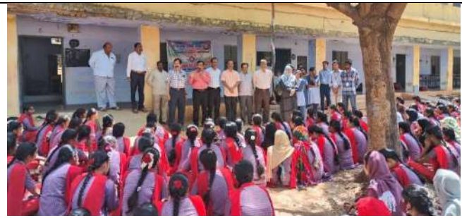
Open Day Awareness Programme / Admission campaign conducted – on 15.02.2023 to increase admissions. The programme was conducted in collaboration with local Junior College Association.