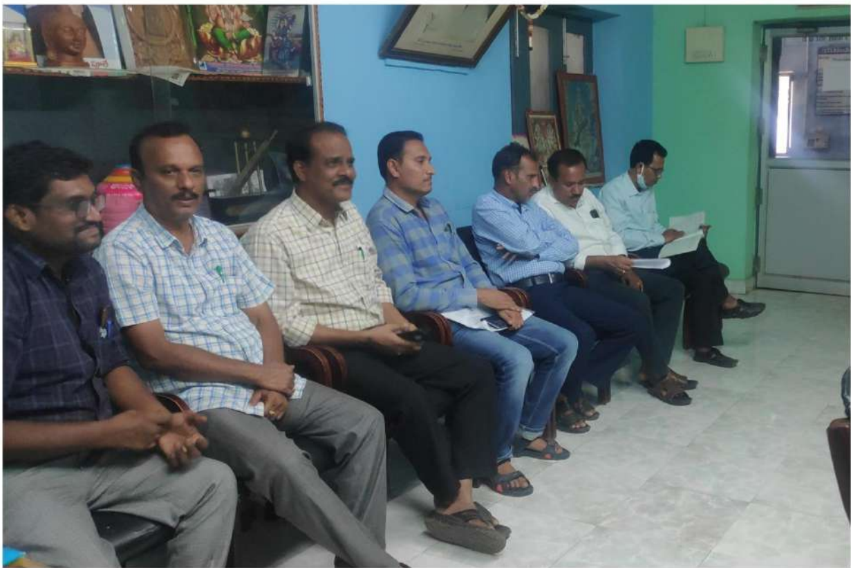
Brain storming session conducted with the criterion in-charges by the IQAC on 15.03.2022