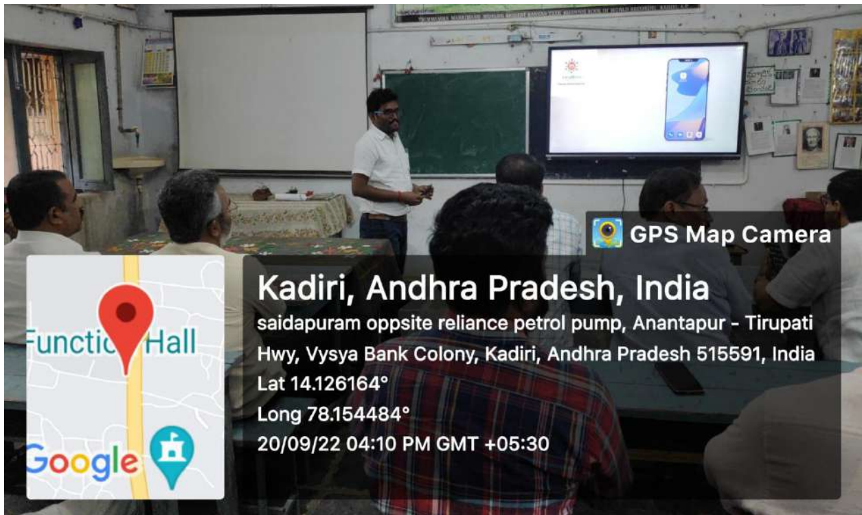
Jnanabhumi App usage Training Programme held on 22.09.2022 for student enrollment and other uses.